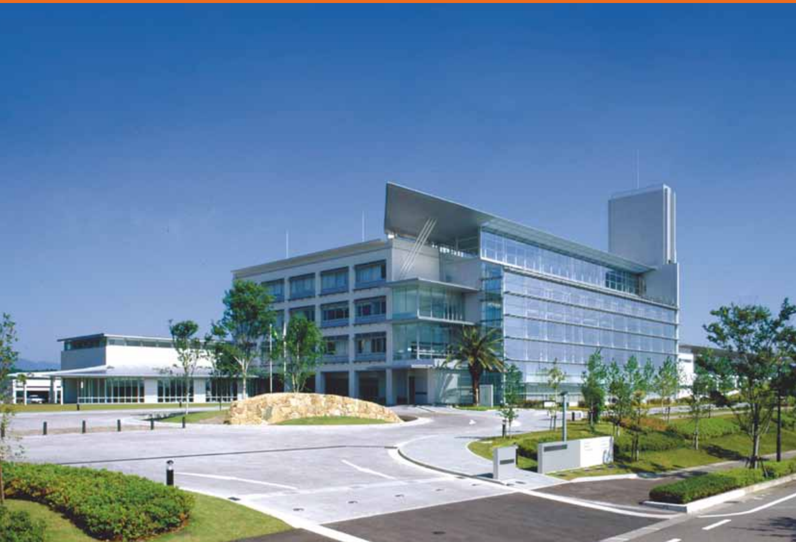
「第19回みやざきテクノフェア」開催地 宮崎県工業技術センター(宮崎市佐土原町 テクノリサーチパーク内)