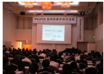
社/宮崎県工業会 第29回定時総会・表彰