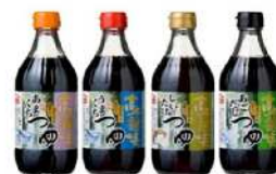
高千穂峡つゆシリーズ

食品の安全安心を担保するために、食品安全マネジメントシステムである「ISO22000」も早い段階から取得し、食料供給基地である南九州を地盤として、地域の食材にこだわった、地域密着型企业として、価値創造企業となるべく邁進しております。