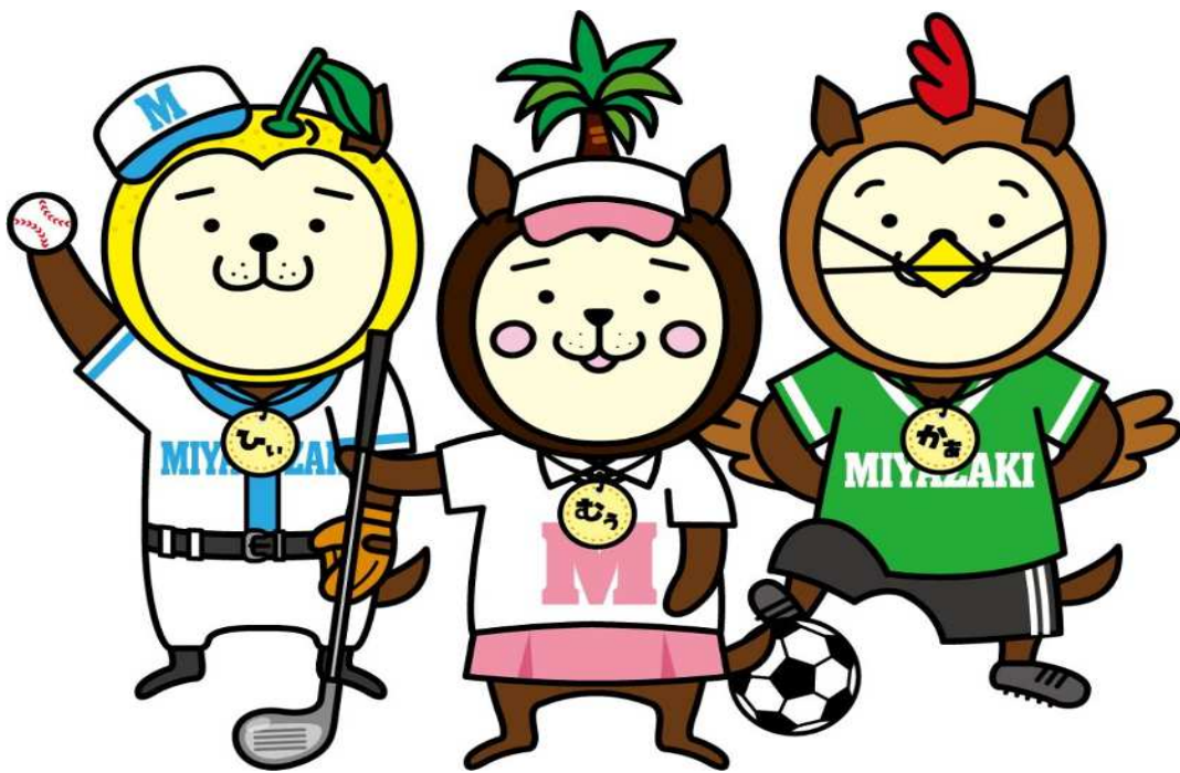
宮崎県シンボルキャラクター「みやざき犬」 みやざき犬使用許可第20180037号