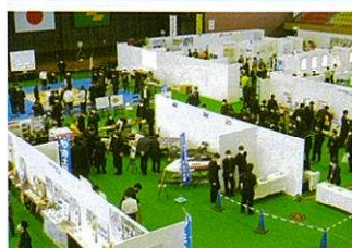
〈学科紹介・作品展示〉