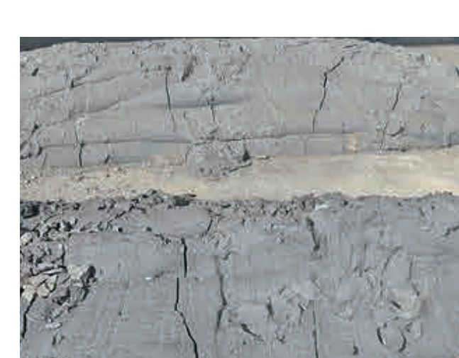
一定期間養生し、強度を発生させる。