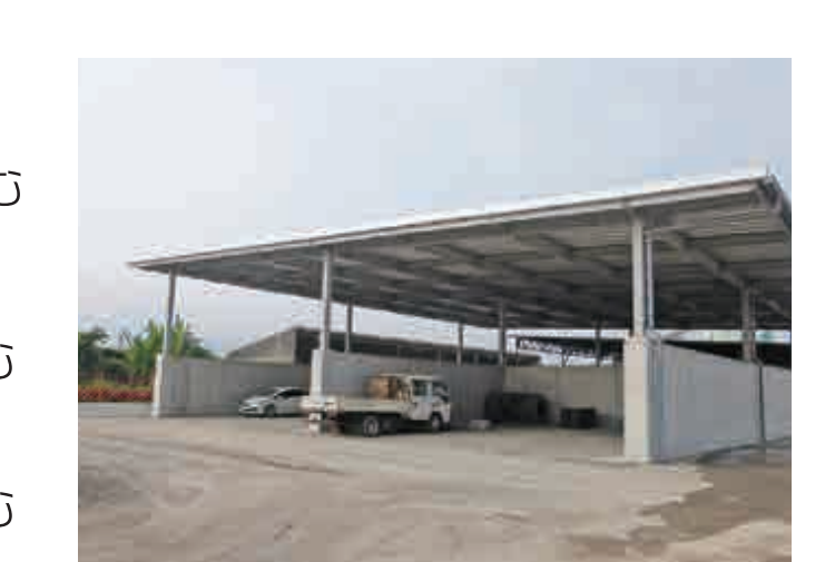
* 養生施設(鉄骨造建屋)