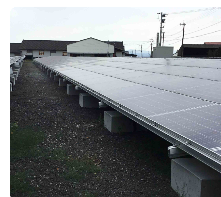
メガソーラーの現場